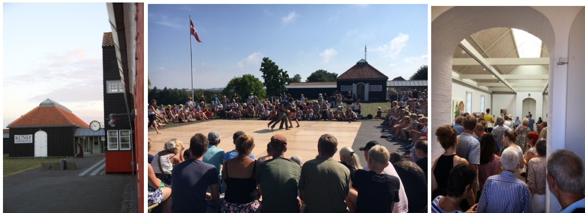
Foto: Fernisagen af årets Holkahest skabte trængsel på museet. Det samme gjorde danseforestillingen som en del af årets Gadeteaterfestival.

På en ekstraordinær generalforsamling i april fik vi vedtaget nogle vedtægtsændringer, især vort kommende ny navn Gudhjem By- og Museumsforening . Det sætter vi i værk fra årsskiftet. Først skal vi lige have markeret foreningens 50 års jubilæum i november under det nuværende navn. Herom mere sidst i nyhedsbrevet.