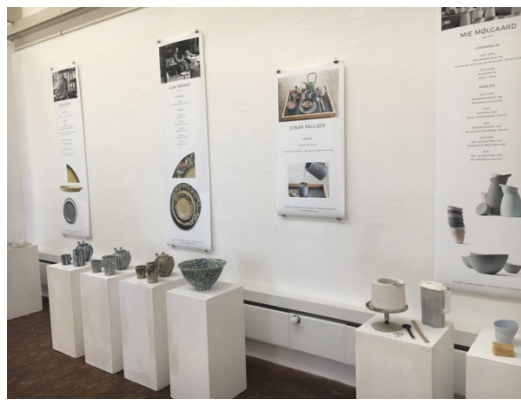
Foto: Fra fernisagen lørdag d. 8. sept. fra udstillingen Bornholmsk Brugskeramik.