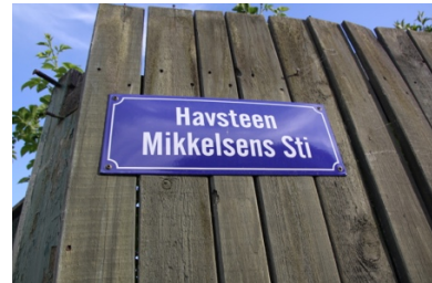
Foto: Ét af de nye træskilte og ét af de nye emaljeskilte der fortæller at her har vi at gøre med særlige lokaliteter.