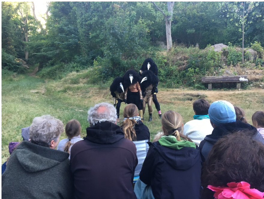
Foto: Fra "Rågerne kommer" – en finurlig forestilling med god humor der udnyttede en af byens mange flotte naturlige kulisser!

Listen er tilgængelig for bestyrelsen og ligger desuden på museet ved skranken - låst inde - med henblik på at medlemskab kan kontrolleres ved besøg på museet, idet adgangen jo er gratis for medlemmer og ikke for andre.