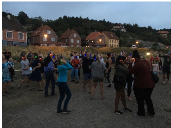
Foto: Maleri af H.P.Haagensen, af røgeribygningen (fra udstillingen med Haagensens billeder) der i dag huser en særdeles populær café. Det andet billede viser festen "Silent Disco" – et særdeles nabovenligt diskotekskoncept fra Gadeteaterfestivalen der foregik ved Café Nørresån.